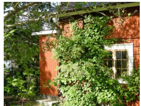
Dasset i lummig sensommargrönka!

Där avbryter vi intervjun. Men vi kan försäkra att stämningen var på topp och tackar för de intressanta och insiktsfulla upplysningarna. Bilder från Kulturdasset nedan och t.h.