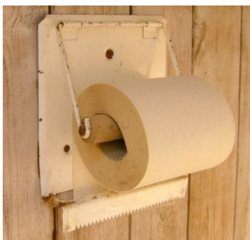
TPH – föredömlig bild!