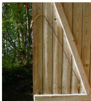
Dassdörr med manöverten