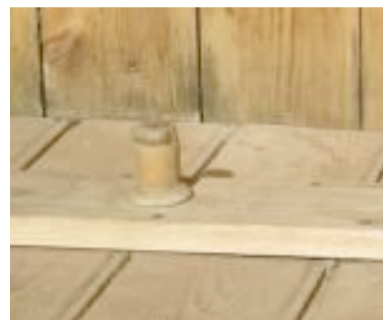
Dasslock med trådrulleknopp

Festligheterna visste ingen gräns och snart kunde alla få tillfälle att provsitta. Med modern solcellsteknik kunde belysning av den ganska smala och ibland vingliga stigen ordnas så att sittningar även efter mörkrets inbrott kunde företas utan risk. På det hela en mycket givande och intressant dag!